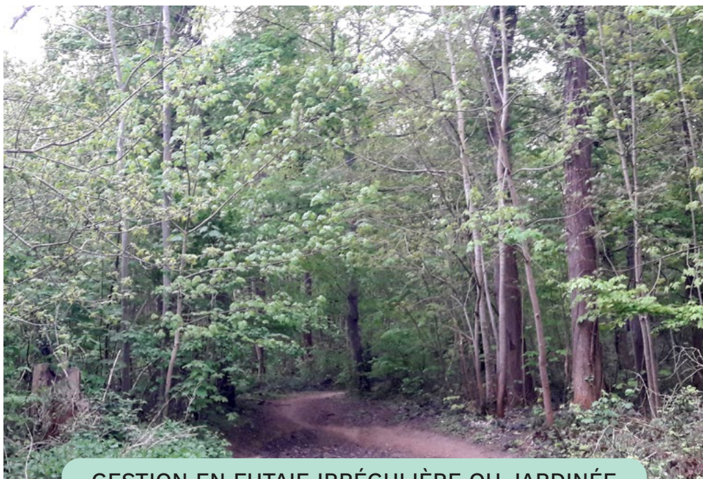
GESTION EN FUTAIE IRRÉGULIÈRE OU JARDINÉE