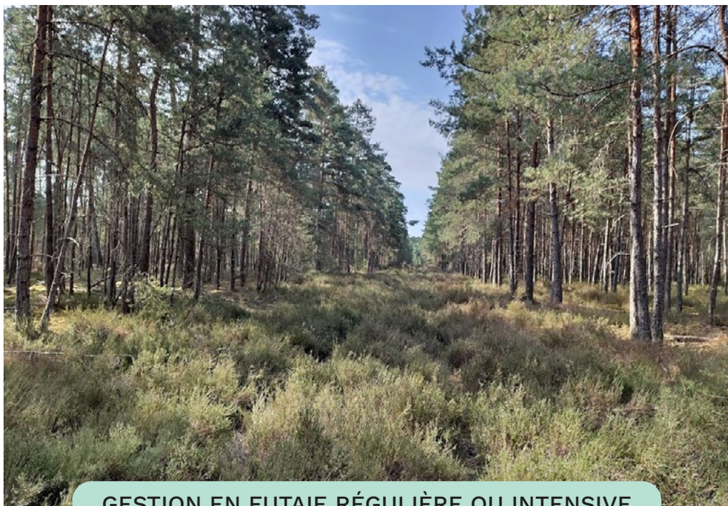
GESTION EN FUTAIE RÉGULIÈRE OU INTENSIVE