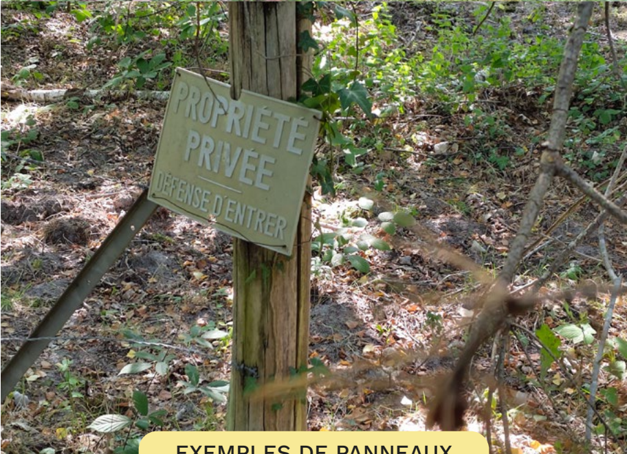
EXEMPLES DE PANNEAUX